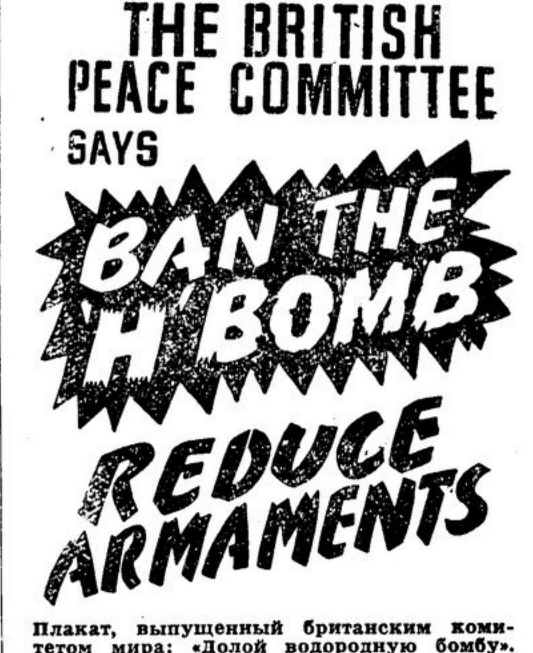
Плакат, выпущенный британским комитетом мира: «Долой водородную бомбу. Сократите вооружения».

Потому делегация обратилась с просьбой принять ее к лидеру лейбористской партии г-ну Эттли, к лидеру консервативной партии г-ну Черчиллю и к лидеру либеральной партии г-ну Дэвису.