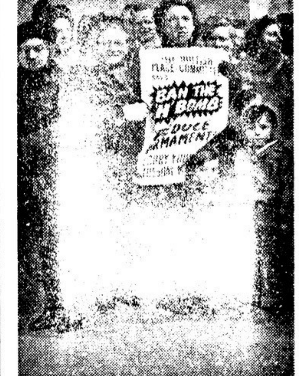
Английские женщины у здания парламента. Они пришли требовать от депутатов выступлений в защиту мира.

Во-первых, по соответствующему закону, когда заседает парламент, то в радиусе мили от него нельзя собираться для политических митингов и произносить политические речи. Именно в связи с этим законом один из грузчиков, разбавивших с макетом атомной бомбы и громкоговоряте-